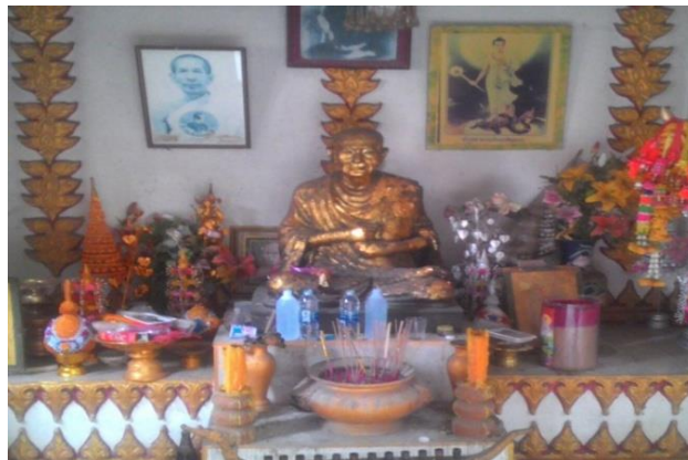
3 วัดลำบัว