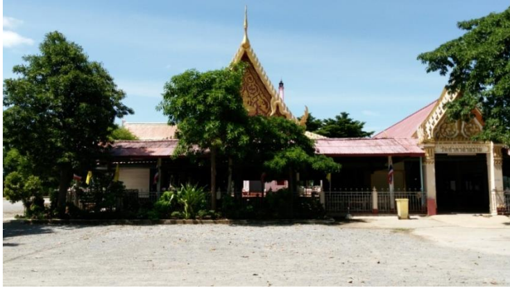
4 ศาลหลวงปู่เนียม