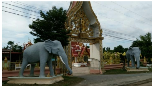
4 วัดศาลาทำทนาย