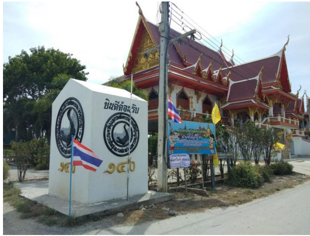
2. มณฑป สมเด็จพระพุทธจารย์โตพรหมรังสี